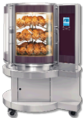
Grill obrotowy Multiserie