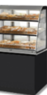
Lady Modular Counter gorące, zimne i neutralne