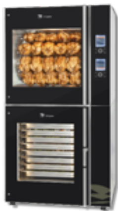
TRC+TDR grill + piec