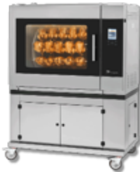
Grill z systemem Auto Clean