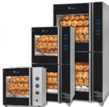
Grille TDR manualne i programowalne