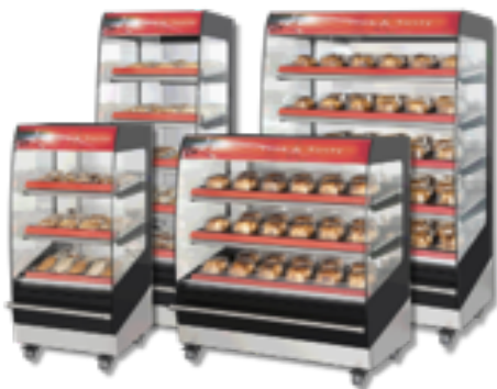
Gorące lady Multi Deck 3,4,5 półkowe