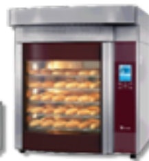
Bake Star 5