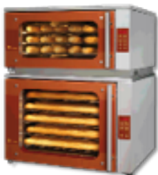
Bake Basic 5+5