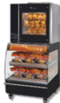
Space Saver: grill + gorąca lada samoobsługowa (powierzchnia 1 m 2 )