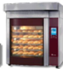
Bake Star 5