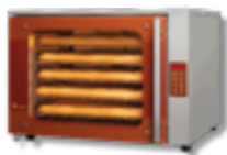
Bake Basic 5