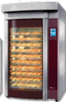
Bake Star 10

FRI-JADO: światowe rozwiązania dla supermarketów