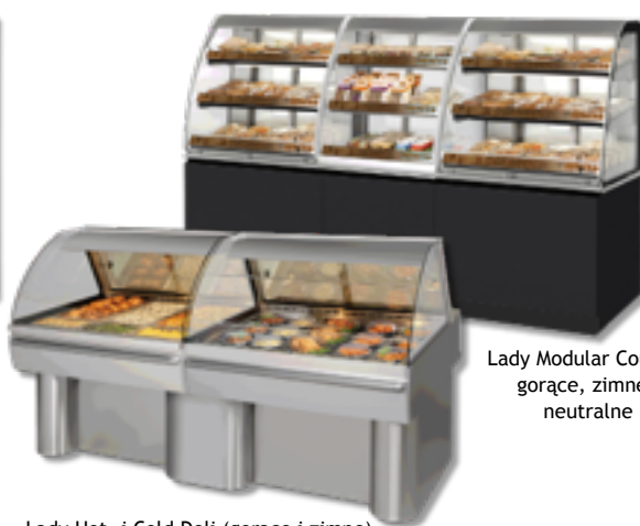
Lady Modular Counter gorące, zimne i neutralne